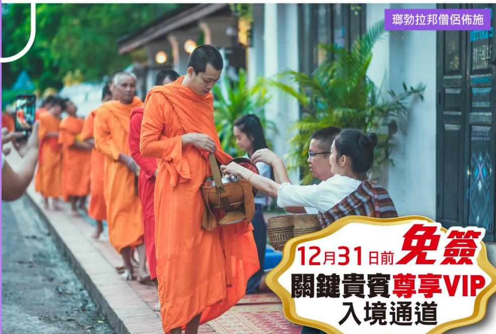
琅勃拉邦僧侶佈施