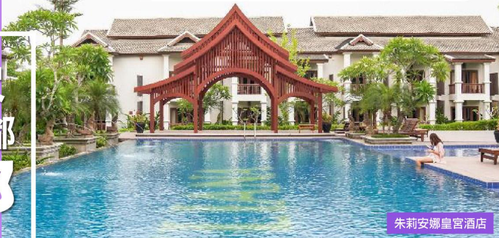
朱莉安娜皇宮酒店