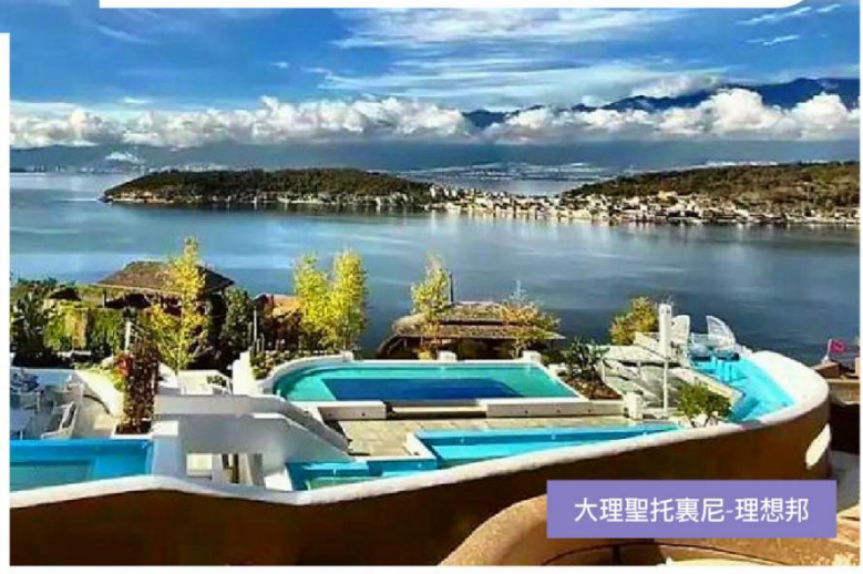
大理聖托裏尼-理想邦