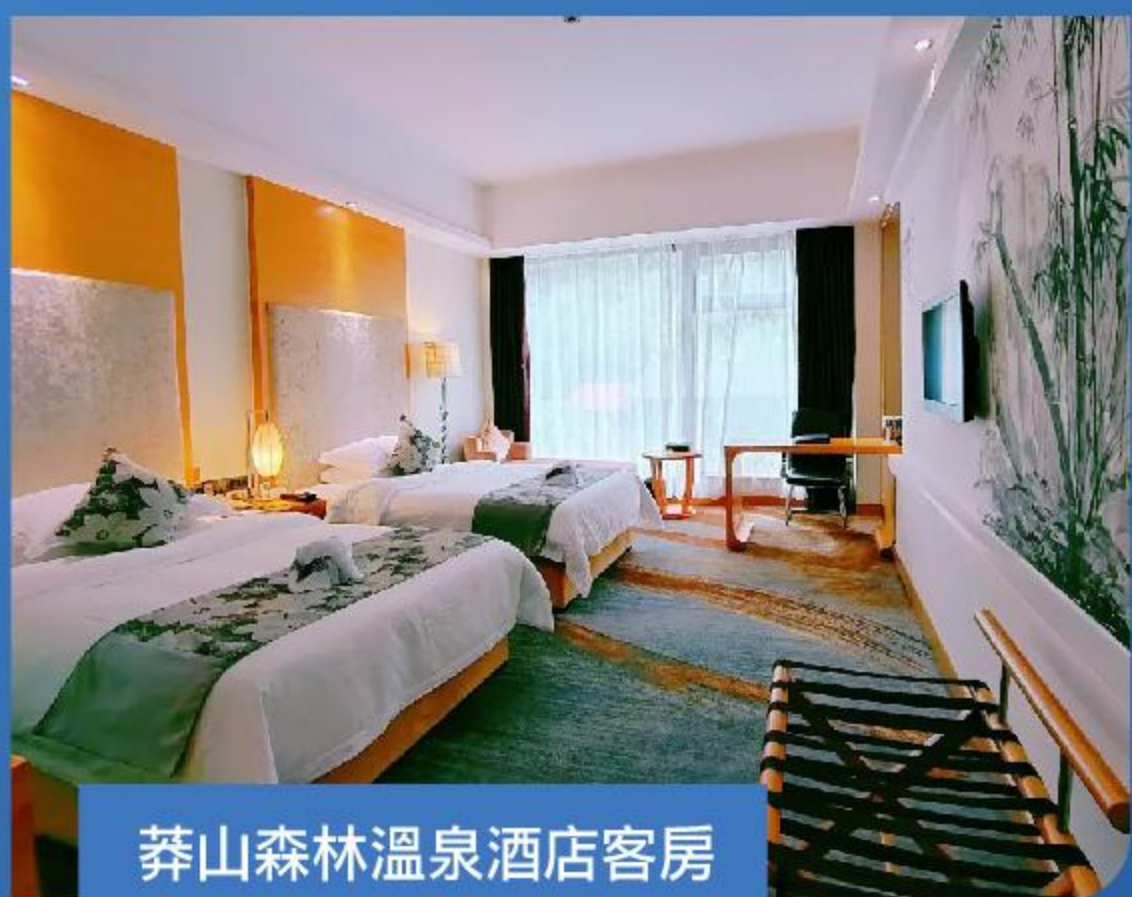
莽山森林溫泉酒店客房