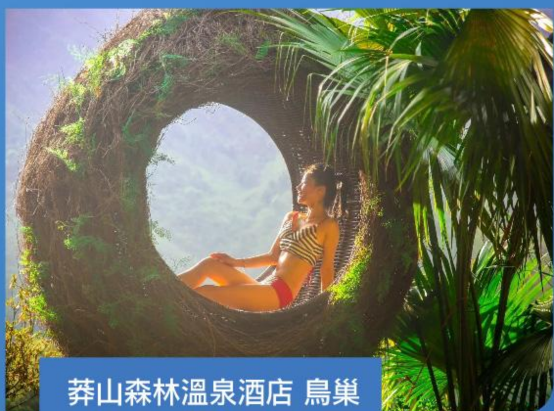
莽山森林溫泉酒店 鳥巢