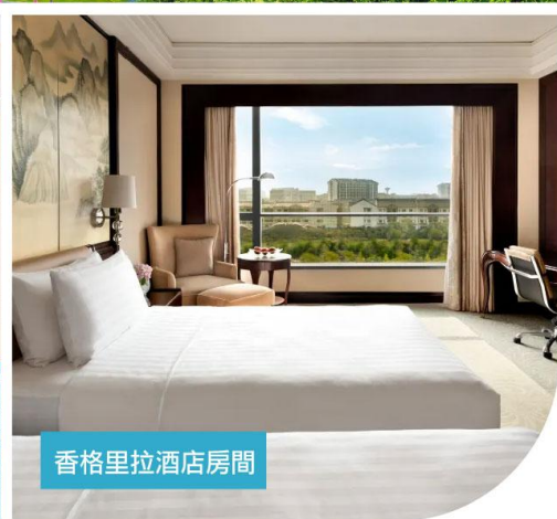
香格里拉酒店房間