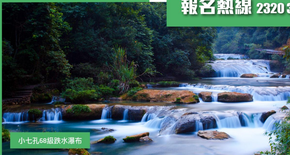
小七孔68級跌水瀑布