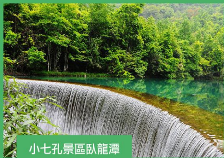
小七孔景區臥龍潭