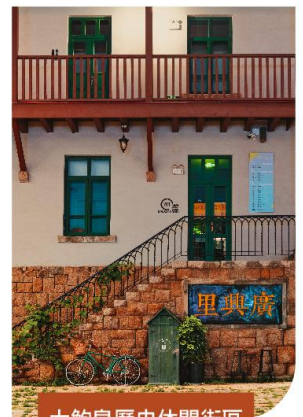
大鮑島歷史休閒街區