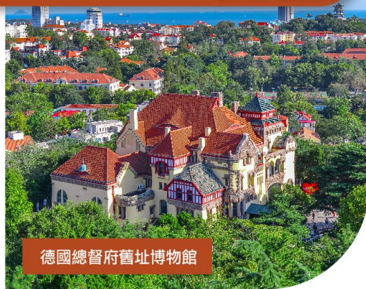
德國總督府舊址博物館