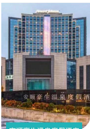
安順豪生溫泉度假酒店