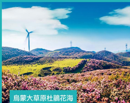
烏蒙大草原杜鵑花海