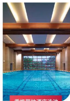
香格里拉酒店泳池