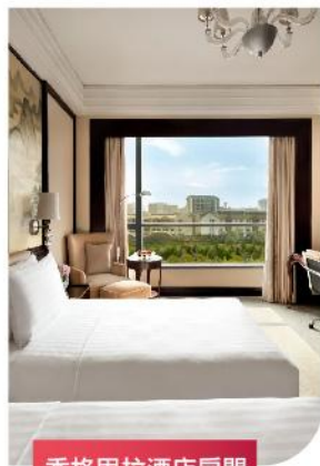
香格里拉酒店房間