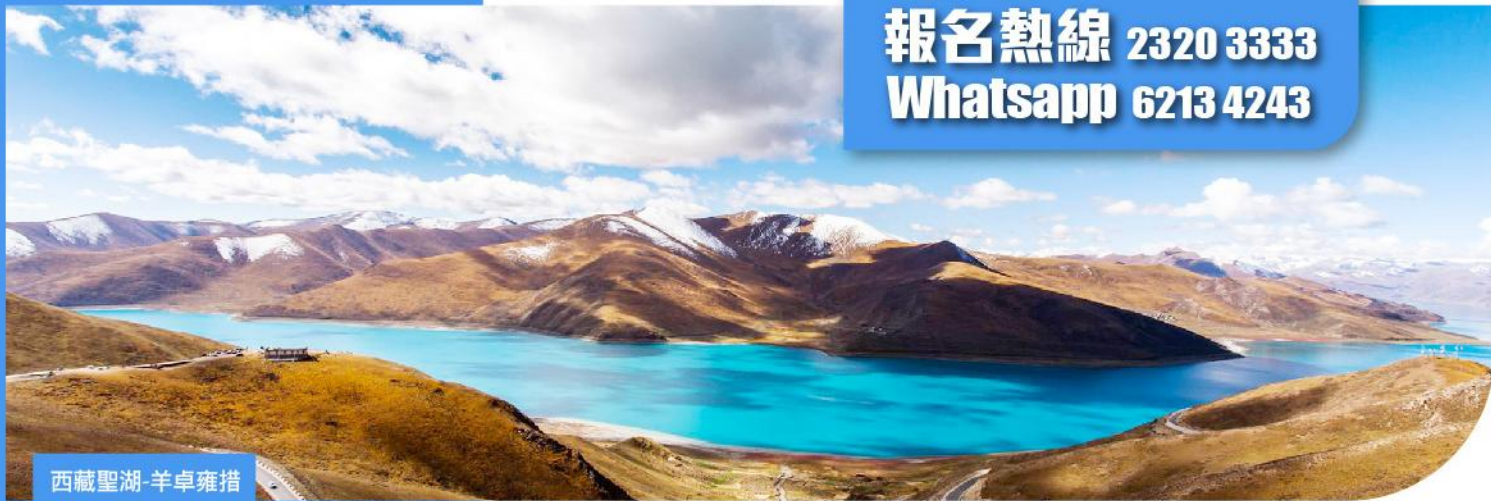
西藏聖湖-羊卓雍措