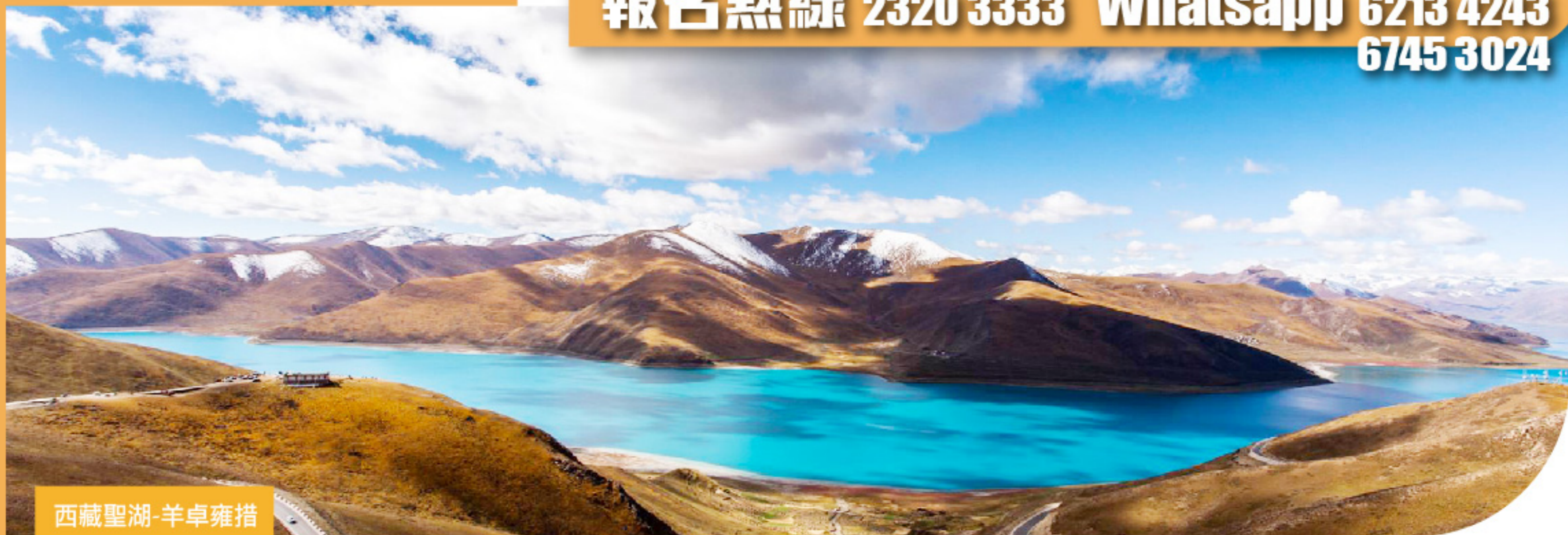
西藏聖湖-羊卓雍措