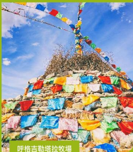
呼格吉勒塔拉牧場