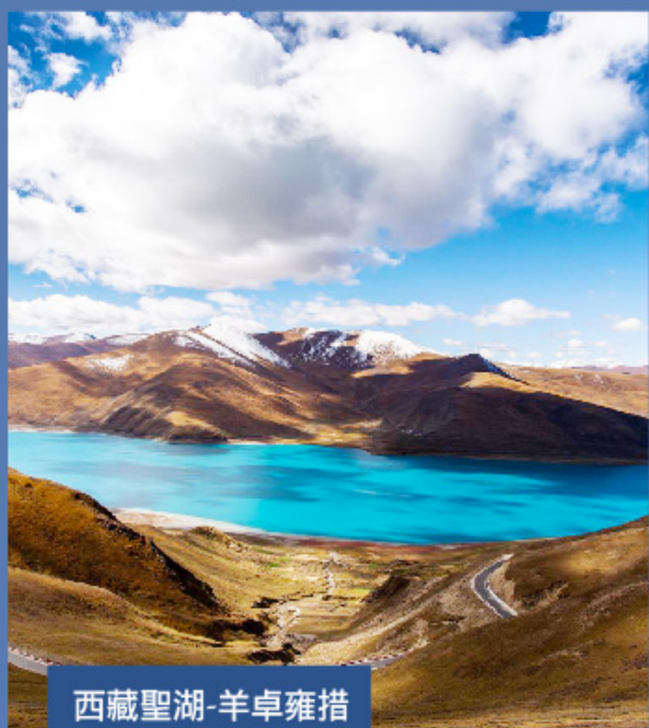
西藏聖湖-羊卓雍措