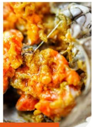
金秋盛宴：每人一對足兩大閘蟹1公1母，每圍台2支紅酒