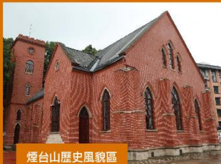
煙台山歷史風貌區